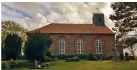
Die Kirche Simonsberg

Die Kirche ist ein rechteckiger Bau in Saalform mit vier Rundbogenfenstern an den Längsseiten. Im Westen finden sich ein kleiner Vorbau und darüber ein Dachreiter.