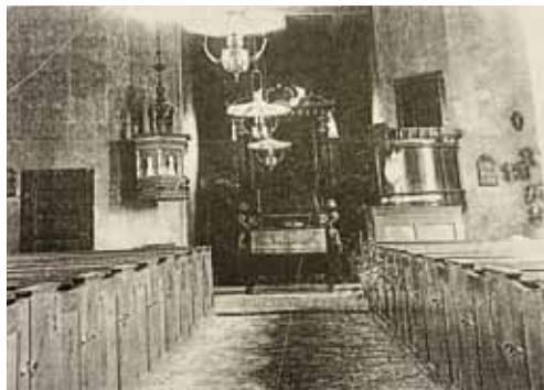
Innenraum der Kirche, Aufnahme vor 1930

Die Kirche St. Salvador ist die vierte Kirche des Ortes. Die erste ging 1532 in der „Allerheiligenflut“ vom 2. November unter. 1 Die zweite von 1545 wurde 1654 durch die zunächst als „Paddelacker Kirche“ bezeichnete ersetzt, die Herzog Friedrich III. angeblich auf eigene Kosten 2 erbauen ließ. Sie wurde 1829/30 abgebrochen und durch einen Neubau nach einem vom dänischen 3 Staatsbauminister Christian Frederik Hansen 4 überarbeiteten Entwurf von W. F. Meyer 1829/30 ersetzt. 5 Die Vorgängerkirche war nach Deichveränderungen den Nordseefluten schutzlos