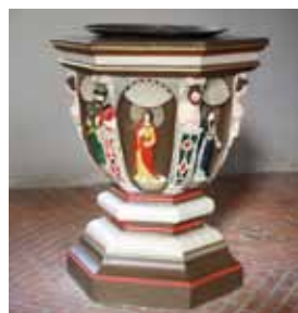
Das Taufbecken aus Eichenholz

Der Altar steht in einer Nische. Die 1601 geschaffene, 92 cm hohe Taufe aus Eichenholz zeigt die Form eines sechsseitigen Pokals, dessen Kuppe (Form einer Trinkschale) auf säulenähnlichen Verzierungen